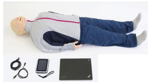
Fig. 2. Laerdal Resusci Anne Q CPR Manikin

본 실험을 진행하기 위하여 PC를 이용한 실습평가용 마네킨(Resusci® Anne SkillReporter™)을 이용하였다. 2분 동안 시행한 가슴압박의 평균을 통하여 가슴압박의 속도, 깊이, 평균 가슴압박과 이완의 비율의 데이터를 이용하였다.