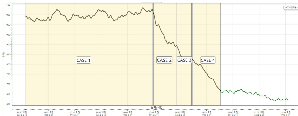
Fig. 3. CO 2 Concentration Curve with Open Area