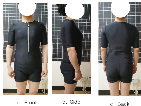
Fig. 3. Figure in a swimsuit

수영복 중심사이즈 패턴의 1, 2, 3차 패턴으로 제작한 실험복에 대한 착용피트성 평가 결과를 Table 7에 제시하였다. 또한 실험복을 착용한 모습은 Figure 3과 같다. 착용감은 1차에서 3차로 가면서 전반적으로 '적당하다'에서 '작다'로 평가되었는데 이는 사이즈가 줄어들면서 탈착시에 불편하였기 때문으로 판단된다. 압박감에서는 1차에서 3차로 가면서 전반적으로 '크다'에서 '적당하다'로 평가되어 최종 3차 패턴의 축률이 적절하게 설정된 것으로 판단된다. 체형 보정성 및 실루엣 적절성에 대한 평가에서도 1차에서 3차로 진행하면서 전반적으로 '그렇지 않다'에서 '그렇다'로 평가되었다.