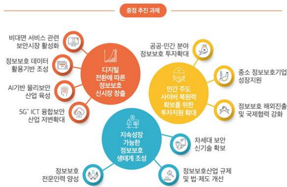
Fig. 2. 2 nd Plan for Promotion of Information Protection Industry

한국인터넷진흥원에서는 ‘2020년 2분기 사이버위협 동향 보고서’를 발표하며 코로나19로 인해 준비하지 못한 원격근무, 원격교육 상황이 시작되었고, 정보보안의 관점에서 검토해야 될 부문이 다수 발생하고 있다고 의견을 제시하고 있다.[15]