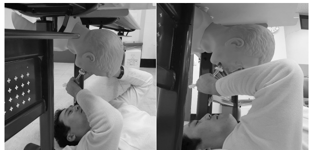
Fig. 4. Use of SALT in supine position