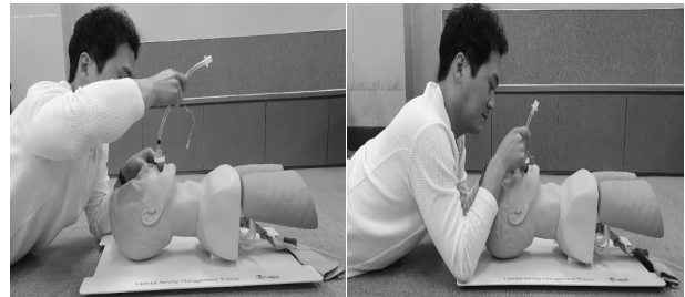
Fig. 3. Use of SALT in prone position

각 설정된 방법에 따라 기관내삽관 시행 시 자신감과 용이성을 측정하기 위하여 시각상사척도(VAS)를 이용하였다. 자신감은 각각 기관내삽관이 끝난 후, 1점에서 최고 점수 10점까지 “자신이 없다”가 1점, “자신이 있다” 10점으로 표시하여 현재 상태를 기입하도록 하였고, 기관내 삽관에 대한 용이성의 경우 1점 “매우 어렵다” 부터 “매우 쉽다” 까지 10점으로 표시하여 그 점수를 사용하였다.