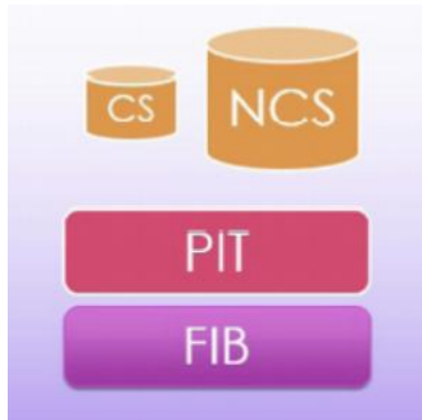
Fig. 3. ECCN architecture[8]

ECCN은 기존 CCN과 패킷 포워딩을 위한 약간의 테이블 차이만 갖고 있다. NCS (Neighbor Content Store)를 추가하여 기존 데이터 외에 중요 정보 데이터를 저장할 수 있다. ECCN 기법에서 패킷 포워딩 및 캐싱을 위한 구조는 그림 5와 같다 [10].