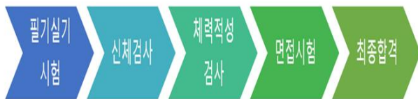
Fig. 1. Police Recruitment

순경의 채용과정은 아래 <Fig. 1>과 같이 필기 및 실시 시험으로 이를 합격한 이들을 대상으로 신체검사, 체력 및 적성검사, 면접시험 마지막으로 최종합격으로 진행이 된다. 필기시험은 한국사와 영어는 필수과목으로 형법, 형사소송법, 경찰학개론, 국어, 수학, 사회, 과학 중 3과목을 선택하게 된다. 신체검사에서는 체격, 시력, 색신, 청력, 혈압, 사시, 문신 등을 검사한다. 체력검사는 100m달리기, 1,000m 달리기, 윗몸일으키기, 좌우 악령, 팔굽혀펴기로 검사하고, 적성검사는 경찰공무원으로서 적성을 종합하여 검정한다. 면접시험은 집단면접과 개별면접으로 진행되고 이러한 모든 과정을 거쳐 최종합격하게 된다.