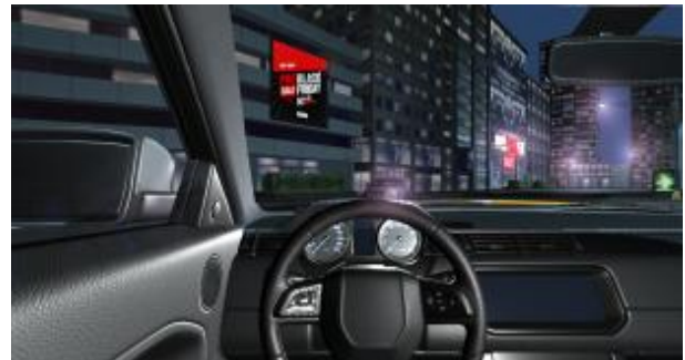
Fig. 3. Conventional driving simulator driving screen

실험은 5일간 실시하며 1일 2회 지정된 주행 코스를 완주하였다. 모든 주행 과정은 저장되며 주행 영상을 재확인할 수 있어 평가 시에 신뢰성을 높였다. 먼저 A그룹은 기존에 존재하는 드라이브 및 운전면허 시뮬레이터의 교육 데이터를 가지고 주행을 시행하였다. 본 논문에서 구현한 시뮬레이터의 시나리오 내용은 운전 교육용으로 개발된 운전 연습 시뮬레이션 게임인 CITY CAR DRIVING (Version 1.5.9)의 콘텐츠 내용을 참고하여 기존의 운전 교육 시나리오를 구현하였다. 다음의 Fig. 3은 CITY CAR DRIVING (Version 1.5.9)의 내용을 기반으로 구현한 야간 도로 주행의 화면이다.