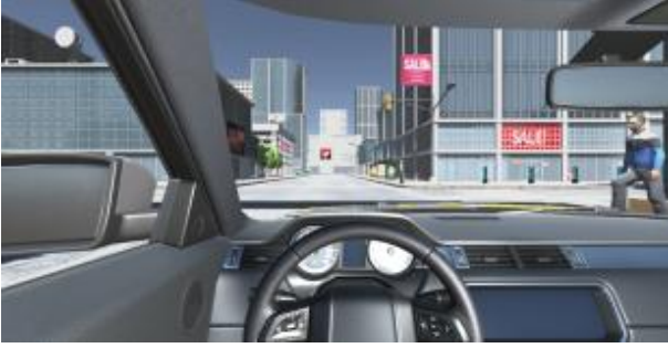
Fig. 4. Scene of Catastrophic Situation

앞의 Fig. 4는 돌발상황 시나리오 중 하나로 무단횡단하는 행인의 갑작스러운 도로 침입에 대한 돌발상황을 나타낸 장면으로써, 상황이 발생하였을 때, 상황에 따른 대처 방법과 알림에 대한 메시지를 화면에 출력하여 사용자에게 상황에 대한 설명과 대처 방법에 대한 정보를 제공한다. 이러한 돌발상황들에 대비하여 반복적인 연습을 진행할 수 있다. 다른 돌발상황에 대한 시나리오들도 돌발상황마다 상황의 중간중간에 대처 방법과 행동 요령에 대한 설명을 팝업 알림창을 통해 사용자에게 정보를 제공한다. 제공되는 정보들을 통해 사용자는 상황에 대한 인지 및 대처 행동에 대한 학습을 할 수 있다.