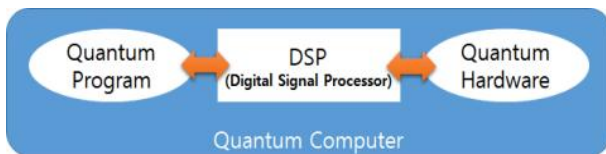
Fig. 2. Quantum Computer Architecture

Fig. 2에서 양자 프로그래밍 언어를 사용해 개발한 양자 프로그램을 고전적인 CPU(Central Processing Unit)에서 명령어로 전환하고, 이를 양자 장치(Quantum Hardware)에서 실행할 수 있도록 신호(Signals)로 전환하는 DSP(Digital Signal Processor)를 거쳐 전달된다. 양자 장치에서 실행되는 명령어는 양자의 상태를 변환하고, 양자의 상태를 측정하는 일련의 작업으로 구성되어 있고, 최종적으로 사용자가 확인하길 원하는 내용을 결과로 전달받을 수 있다. 다음 절에서 양자 장치를 구성하는 방법에 따라 달라지는 두 가지 유형의 양자 컴퓨터를 다루도록 한다.