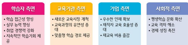
Fig. 3. Impact of introducing microdegrees

마이크로디그리가 컴퓨터의 새로운 기술 교육에 미치는 영향은 다양한 측면에서 나타나고 있으며, 이는 크게 학습자, 교육 기관, 기업, 그리고 사회 전반적인 측면으로 나누어 살펴볼 수 있으며, Fig. 3과 같다.