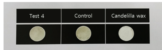
Fig. 1. Hydroxyapatite disk(artificial teeth) stained by staining solution

실험실적 HAP시편의 명도 변화량 평가에서 가장 효과적으로 확인된 실험4군에 대하여 착색억제 작용을 육안으로 확인하고자 stain용액에 착색시키지 않은 백색의 HAP시편을 사용하여 실험4군 치약과 대조치약 및 표면코팅 효과가 예상되는 칸델릴라왁스를 각각 도포하고 흐르는 물에 씻은 후 stain용액에 24시간 침적 후 관찰한 결과 칸델릴라왁스 원료로만 처리한 시편은 거의 착색이 되지 않은 것을 관찰할 수 있었다<Fig. 1>.