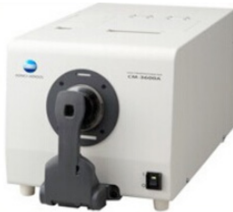
Fig. 2. CM-3600A, Minolta, Japan

코어와 베니어 두께의 평균±표준편차는 p값은 <Table 1>과 같다. IPS e.Max CAD 코어와 베니어 0.8 mm/0.7 mm (LD1)은 1.506±0.001, IPS Empress CAD 코어와 베니어 0.8 mm/0.7 mm (LR1)은