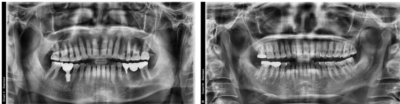
Fig. 2. Panorama images of case 1 (left) and case 2 (right)