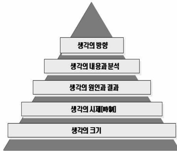
(그림 1) 생각 점검표