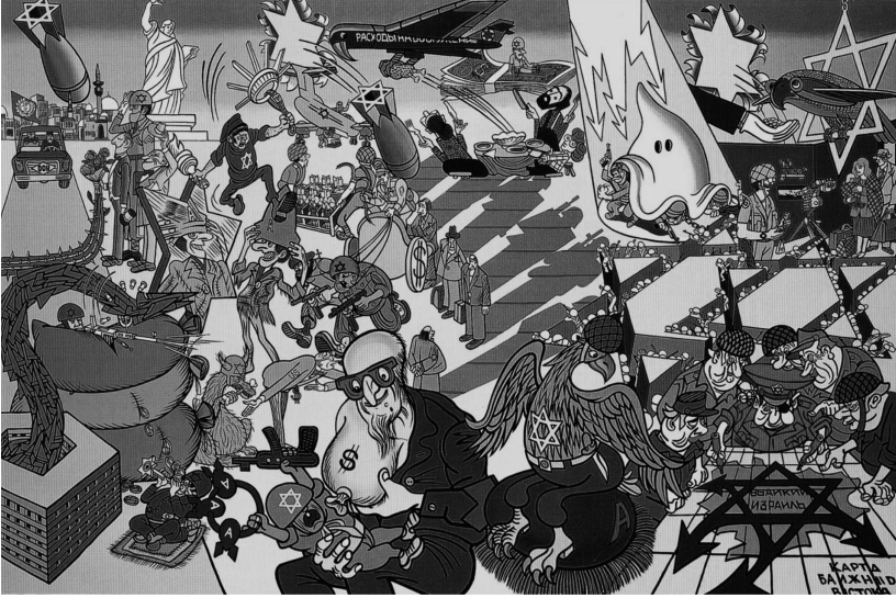
도판 5. 에로, <이스라엘>, 1976, 캔버스에 유화와 글리세로프탈산 래커, 139×195cm, 레이카비크 시립미술관(Musée municipal, Reykjavik) 내 에로 컬렉션, 아이슬란드.