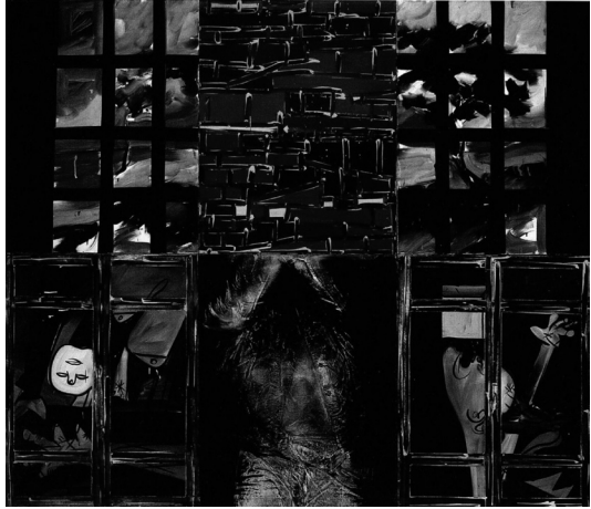
도판 8. 안토니오 레칼카티, 〈피카소와 함께〉, 1963, 캔버스에 유화, 180×210cm, 디 메오 갤러리 (Galerie Di Meo), 파리.

이탈리아 태생 친구상 작가인 레칼카티의 작품은 앞서 살펴보았던 작가들과는 달리 패러디의 유희적 측면을 배제하였음에도 명확하게 풍자적 어조를 띠고 있다는 점에서 독특하다고 볼 수 있다. 19 〈피카소와 함께(Da Picasso)〉(1963) (도판 8)에서 그는 화면을 6등분하여, 위의 양 두 칸에는 일상적 풍경을 담은 가시적 세계를, 그 외의 칸에는 강제적이고 억압적인, 은폐된 현실세계를 묘사하였다. 손이 묶여 매달려 있는 인물은 고문과 같은 공권력의 폭력을 연상시킨다. 20 여기서 그는 하단의 양 옆 칸에 피카소의 〈게르니카〉(1937)에서 볼 수 있는 모티브를 마치 어두운 감옥에 갇힌 것처럼 그려 넣었다. 게르니카 모티브