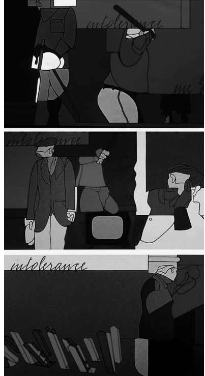
도판 3. 발레리오 아다미, <불관용>, 1974, 캔버스에 아크릴, (3x)210×350cm, 갤러리 매그(Galerie Maeght), 파리.

면을 중심으로, 의미를 가늠하기 어려운 다양한 이미지들을 그려 놓았다. 그는 끝없이 줄지어 펼쳐진 책들을 통해 획일적인 교육제도에 대해 일침을 가하는 듯 보이며, 왼쪽에 보이는 ‘OUI(‘예’라는 뜻)’와 ‘JAMAIS(‘결코... 않다’라는 뜻)’가 쓰인 종이판으로는 흑백논리가 만연한 사회 풍조를 보여주는 듯 보인다. 그 중 미국의 지도에 깔려 있는 사람의 형상은 비교적 직접적인 언급으로서 보스의 반미적 성향을 짐작하게 한다. 그러나 가장 눈에 띄는 것은 풀 수 없는 암호로 가득 찬 이미지들 속에서 유일하게 읽히고 있는 글자들로, 화면의 가장 윗부분에 쓰인 ‘ho’와 ‘mao’ ‘che’이다. 이 글자들은 각각 호치민(Ho Chi Minh)과 마오쩌둥, 체 게바라의 애칭을 써놓은 것으로서 모두 좌파 정치사상