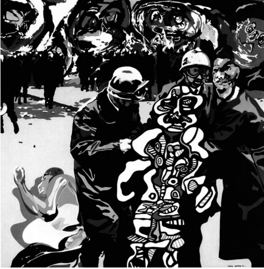
도판 7. 에퀴포 크로니카, <그것은 도망치지 않아요>, 1971, 캔버스에 아크릴, 200×200cm, 발렌시아 시립 미술관.

신구상 내 소그룹으로, 활동하는 시기 내내 패러디 작업에 열중했던 작가들이다. 18 그들은 <그것은 도망치지 않아요(Este no se Escapa)>(1971)(도판 7)에서 무장경찰들이 장 뒤뷔페(Jean Dubuffet)의 조각을 끌고 가는 우스꽝스러운 장면을 통해 공권력의 폭력성을 희화하였다. 화면의 왼쪽에 옷이 벗겨진 채 쓰러져 있는 인물은 무장경찰의 무자비함을 드러내고 있으며, 경찰 중 한 명이 관람자에게로 시선을 돌리고 있어 누구나 공권력에 의해 제압당할 수 있음을 경고하고 있다. 그러나 어두운 검은색 계열의 무장경찰 군상이 주는 공포와 대조적으로, 뒤뷔페의 조각과 먼 후경을 채우고 있는 다채롭고 선명한 색채들은 경찰들의 진지한 태도를 웃음거리로 만드는 요소로 작용하고 있다. 에퀴포 크로니카는 이 같은 방식으로 주로 19세기 말에서 20세기 초에 이르는 아방가르드 미술가들의 작품을 패러디하였으며, 신구상 작가들 중에는 아로요와 헤르만 브라운 베가(Herman Braun-Vega)가 그들과 유사한 작업을 구사하였다.