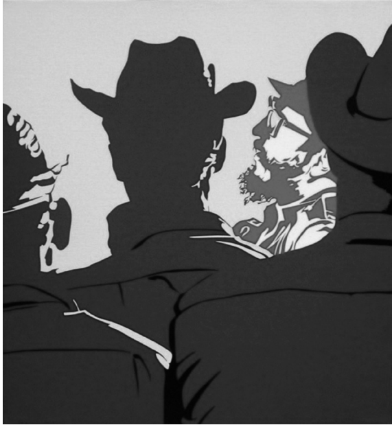
도판 1. 베르나르 랑시악, 〈피델〉, 1967, 캔버스에 비닐계 (vinylique) 물감, 200×185cm, 아반느 미술관(Musée de la Havane), 쿠바.

피델은 독재적인 군부 지도자가 아닌 동등한 입장에서 인민과 함께 하는 이상적이고 지적인 지도자로 보인다. 이로써 랑시악은 자신만의 방식으로 혁명가를 해석하고 표현하면서도, 쿠바 혁명의 성공을 지지하는 자신의 바람을 전달할 수 있었다.