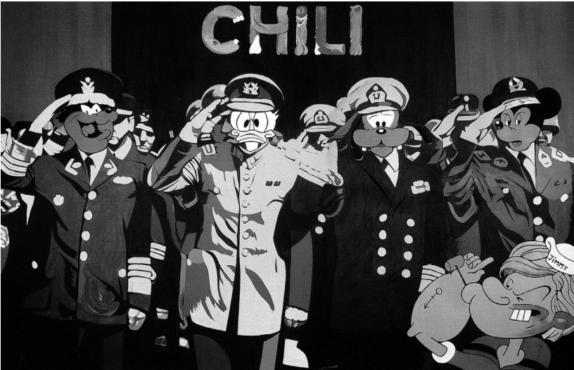
도판 6. 베르나르 랑시악, <유혈 만화>, 1977, 캔버스에 아크릴, 195×300cm, 돌 미술관(Musée de Dôle), 프랑스.