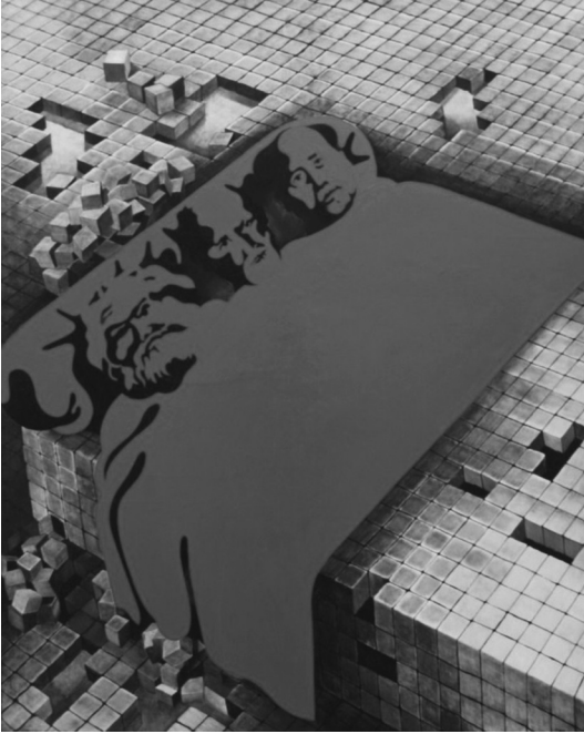
도판 2. 앙리 쿠에코, <마르크스, 프로이드, 마오>, 1969-70, 캔버스에 유화와 글리세로프탈산 래커, 162×130cm, 파리시립미술관.

라면 누구에게나 친숙한 이미지였던 것이다. 13 팝아트 작가들과 마찬가지로 이러한 시대적 특성을 포착했던 신구상 작가들은 역으로 그러한 얼굴 이미지가 지니는 대중적인 힘을 수용하여 예술작품의 가독성을 높이는 데 활용하였다.