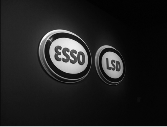
도판 9. 외위빈드 팔스트림, <ESSO LSD>, 1967, 열성형 플라스틱, (2×)89×127×15cm, 발렌시아 현대미술관.

특유의 호소하는 듯한 몸짓과 피카소라는 거장의 작품이 지니는 아우라로 인해 이 작품이 조롱하는 어두운 사회는 관람자들에게 강렬한 인상으로 다가갈 수 있었다.