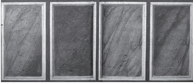
도판 3. 프라 안젤리코, 〈성스러운 대화〉 하부 세부, 1438-1450, 프레 스코, 195×273cm, 산 마르코 수도원.

의 대상이었다. 디디 위베르만은 이 패널은 대리석의 외양을 모방하지만 분명하게도 진짜 대리석이 아님을 드러낸다고 지적한다. 패널 위 의도적으로 뿌렸음이 틀림없는 흰색 물감 자국은 일종의 지표적 기호로 대리석과의 도상적 유사성, 외양적 유사성을 훼손하기 때문이다. 그런데 흰색 물감은 어렵지 않게 성모의 우유, 도유 의식 24 을 상기한다(도판 3). 신성한 존재의 외양을 모방하고 있는 구상적 회화 부분보다 여기 없는 존재, 보이지 않는 존재, 재현할 수 없는 존재인 신을 더 잘, 비유사성의 방법에 따라 형상화하고 있는 것은 결국 이 패널의 형상들이다. 형상화는 유사성을 생산하는 작용이 아니라 여러 층위 사이에 확정되지 않고 계속 자리를 바꾸는 운동을 만들어내는 ‘이행의 기호(signa translata)’를 사용하여 유사성과 비유사성의 변증법적 관계를 생산하는 일이다.