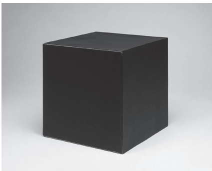
도판 4. 토니 스미스, <다이(Die)>, 1962, 강철, 183×183×183cm, 파올라 쿠퍼 갤러리.

간처럼 쓰러진다 (인간을 닮았다). 불가능한 두 가지의 모순적 존재가 여기 함께 모습을 드러낸다. 이들은 단단하지만 비어 있다. 따라서 공백, 더 정확히 말해 모순 상태의 공백이 우리를 끈질기게 응시한다. 따라서 우리는 이 오브제들을 특정하고 분명한 것으로 파악하는데 어려움을 겪는다. 예를 들어 전