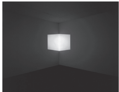
도판 5. 제임스 터렐, <에이프럼 I (Afrum I)>, 1967, Projected Light, 가변 크기, 뉴욕 구겐하임 미술관.

제임스 터렐은 미국 로스앤젤레스의 퀘이커교도 집안에서 태어났다. 제임스 터렐은 1966년 공간 안에 투사한 기하학적 빛의 체적인 <에이프럼(Afrum)>을 만들었고 같은 해 오션 파크에 위치한 멘도타 호텔을 빌려 장소특정적 성격의 작업을 구상하기 시작했다(도판 5). 터렐은 이 작업에 <멘도타 두절(The Mendota Stoppages)>라는 제목을 붙여 1969년 공개한다. 멘도타 호텔은 어둡고 텅 빈 실험 공간으로 변형되었고, 이 공간 안에 자연의 빛과 인공 빛이 투사되었다. 터렐은 1967년 파사데나 미술관(Pasadena Art Museum)