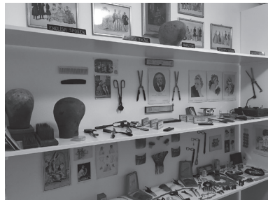
도판 3. 《할아버지》(1974)의 복원 전시(2018) 정경, 스위스 베른