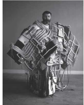
도판 1. 에티엔느 마르탱, 〈거주지 no. 5〉, 1962, 금속, 방수포, 천, 트리밍 장식, 빛줄, 250×230×75cm, 풍피두 센터, 파리.

그렇다고 제만이 《도큐멘타 5》에 정신병동의 예술을 전시할 때, 그들의 출신 신분을 감춘 것은 아니다. 정신병동의 예술은 “섹션 11: 광기의 예술적 기교, 정신질환자들의 산물에서 이미지의 정체성”에서 소개되었다. 섹션 11은 그 유명한 “섹션 12: 개인적 신화”가 위치한 노이에 갤러리(The Neue Galerie)의 1층에 위치했다. ‘개인적 신화’라는 개념은 프랑스 아티스트 에티엔느 마르탱(Etienne Martin)에게서 비롯된 것이다. 제만은 이미 1963년 베른 쿤스트할레에서 그의 작품을 전시한 바 있고, 그의 독특함을 높이 평가하면서 ‘개인적 신화’라는 표현을 썼다. “에티엔느 마르탱은 조각가면서 한편으로 연금술사이자, 자신만의 신화를 창조하는 사람이다. 그는 안토니오 가우디와 우