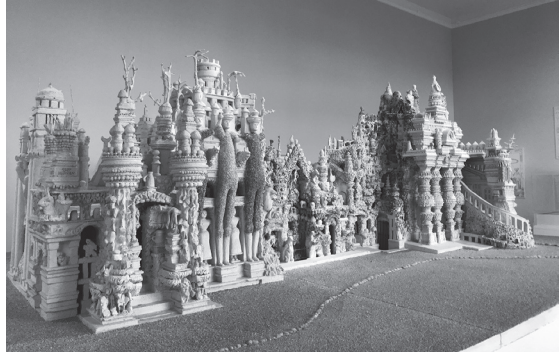
도판 7. 《총체예술을 향한 경향》(1983)을 위해 제작된 페르디낭 슈발의 〈이상적 궁전〉 모형, 알랭 뒤페롱(Alain Duperron) 제작.

을 향한 경향”이라고 밝힌 것은 사실 총체예술작품이 존재한다기보다 그것을 향한 야망과 열망을 보여주고자 함이었다. ‘강박의 박물관’이라는 개념을 유지하면서, 제만은 “강렬한 의도들로 이루어진 미술사의 흔적과 작품들을 통해 예술가가 요구하는 ‘무엇’과 ‘방법’을 시각화하기를” 원했다. 그는 세상을 전체론적으로 보는 창작자의 “축약된 세계를 생산하려는 욕망, 열망, 갈망, 필요, 고백, 강박, 예술에의 집중, 해방을 향한 청원”을 구체적으로 표현하려는 작품들을 모았다. 39 이러한 유형의 작품들에서 공통적인 점은 결과보다 과정이 중요하다라는 점이다.