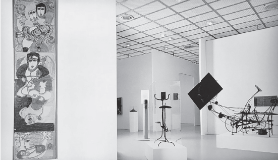
도판 8. 《환영의 스위스》(1992) 전시 정경. 취리히 쿤스트하우스. 텅글리와 코르바스 작품의 만남이 보임.

가진다고 선언하면서, 이 세 나라의 비저너리들(visionaries)의 시리즈 전시에 착수한다. 각 전시는 제만이 각 나라의 관련 뮤지엄 컬렉션 중에서 작품을 선택하는 식으로 진행되었다.