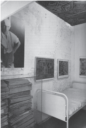
도판 2. <도큐멘타 5>(1972)에 재현된 아돌프 빌플리의 독방, 3.5x2.35x3.28m.

섹션 11은 박물관, 아돌프 빌플리의 독방, 슬라이드쇼와 비디오를 위한 구역, 이렇게 세 개의 방으로 나뉘어져 있었다.