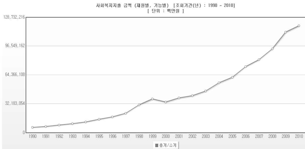
[그림 3] 한국의 사회복지지출 추이