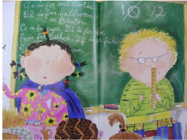
(1a) 출발어 텍스트 삽화(Curtis 2002: 10-11)

상기 출발어의 삽화가 어떤 방식으로 현지화되었으며 어떤 효과를 창출하는지 살펴보도록 하자.