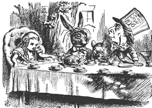
『Alice’s Adventures in Wonderland』에 나오는 테니얼(John Tenniel)의 삽화

발어텍스트의 흔적을 충분히 보존하고 문화적 차이를 보일 수도 있지만, 공현존(copresence)이 없거나 거의 없는 경우 현지화를 고려해야 한다. ‘이국적’이라는 반응을 넘어 이해용이성에 걸림돌이 되거나 엉뚱한 방향으로 이해를 유도한다면 번역의 기초적인 목적이 달성되지 않기 때문이다. 대표적인 삽화 현지화의 예로 『Alice’s Adventures in Wonderland(이상한 나라의 앨리스)』의 카탈로니아어 번역본(Gutiérrez 옮김 2002/Anglada 삽화)을 꼽을 수 있는데, 아래 삽화만 보더라도 매드헤터의 그로테스크하고 광대 같은 모습 10) 이 19세기 카탈로니아 신사로, 주전자는 카탈로니아에서 익숙한 모양으로, 영국의 오두막 모습은 카탈로니아의 뜰로 바뀌었음을 알 수 있다.