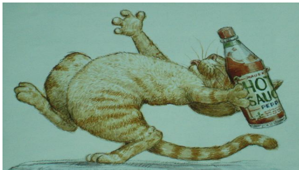
(3a) 출발어 삽화(Artell 2003: 20)

상기 출발어의 삽화가 어떤 방식으로 도착어 텍스트에서 현지화되었으며 어떤 효과를 창출하는지를 아래에서 살펴보도록 하자.