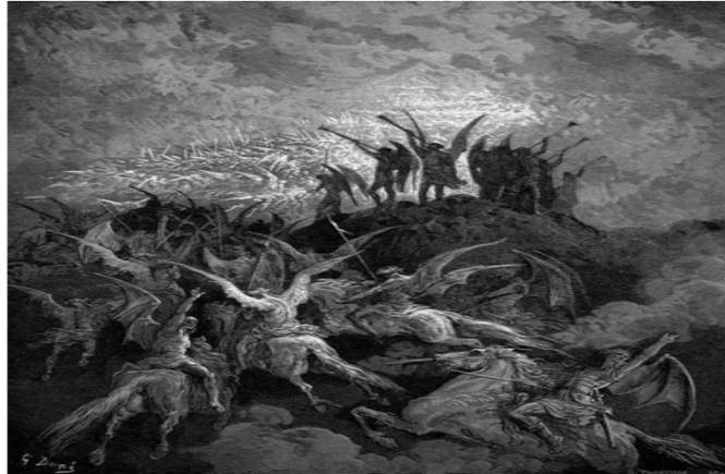
『Paradise Lost(실락원)』에 나오는 구스타브 도레(Gustave Dore)의 삽화

이코노텍스트 중에서도 최초의 어린이 그림책은 1965년 출판된 아모스(AMOS)의 『Orbis Sensualium Pictus(세계의 그림)』이며, 이 작품의 경우 교육적 목적을 지녔으며 글과 삽화의 상호보완성을 통해 텍스트가 완성되고 있다(신명호 1994: 15). 이 책은 어린이 그림책의 귀감이 되었으며, 이후의 그림책은 대다수가 이를 따라 내용적인 측면에서는 사랑, 가족, 삶, 죽음 등의 인류 보편적 가치를 다루고 있으며 형식적인 측면에서는 삽화와 글이 조화를 이루어 하나의 텍스트를 구성하고 있다.