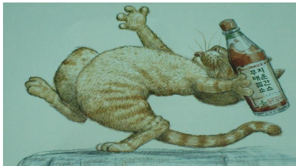
(3b) 도착어 삽화(한강 옮김 2003: 20)

(3)의 작품은 『빨간 모자』를 패러디한 어린이 그림책으로 4-7세를 대상으로 하고 있다. 독자층이 어릴수록 작품에서 그림이 차지하는 비중이 상당히 높