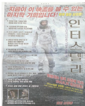
그림 1 영화 <인터스텔라>의 신문광고

본 연구는 2014년 12월 16일 중앙일보 19면(조선일보 17일자 A22면)에 실린 영화 <인터스텔라>의 전면광고(그림 1)에서 비롯되었다.