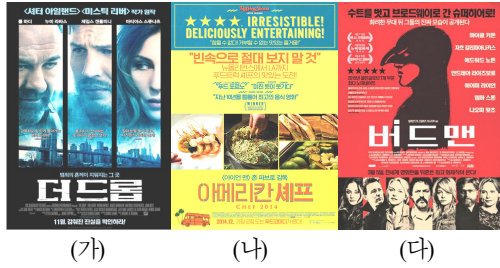
그림 9 테스트imoni얼 명시화의 사례

(가) 테스트imoni얼이 추가적인 기능을 하는 경우: 영화 <더 드롭>의 국내포스터에는 원문에 없던 테스트imoni얼이 세 개나 추가되었다. 이는 포스터의 이미지가 세 개의 공간으로 나뉘어 있고 광고면 중앙에 어떠한 카피도 없음을 고려할 때, 나쁘지 않은 선택으로 판단된다. 첨가된 문구는 각각 “툼 하다가 선사하는 또 하나의 엄청난 연기! - VARIETY”, “절대 눈을 땔 수 없고, 서스펜스가득한 연기 - KING TV”, “강력하고 힘 있게 몰아가는 범죄 드라마! - ROLLING STONE”으로, 이는 모두 직역에 가깝다. 가령, 세 번째 테스트imoni얼의 경우 영화평론가 피터 트라버스의 리뷰인 “[...] a potent, propulsive crime drama [...]”를 번역한 것이다(Travers 2014. 9. 11). 이 포스터의 테스트imoni얼은 슬로건, 바디카피와 함께 영화에 대한 다양한 정보를 제공하고 있다.