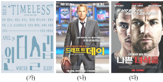
그림 6 바디카피 명시화의 사례

(가) 영화의 외적정보를 명시화하는 경우: 클래식 영화 <윈터슬립>의 국내 포스터에는 영화가 완성되기까지 작품과 감독에게 큰 영향을 미친 음악가, 작가, 감독명 등이 열거되어 있다(지면의 4분의 1을 차지). 영화의 배경 이미지를 부각시킨 영어포스터와는 달리, 국내포스터에는 영화의 제작과 관련된 추가 정보가 포함되었다. 5)