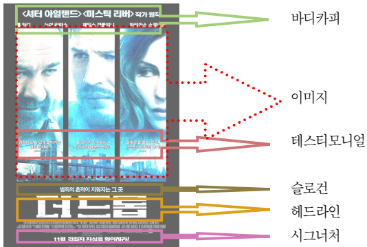
그림 4 광고의 틀을 이용하여 재해석한 국내 외화포스터의 구조

하지만 국내 외화포스터를 광고이론으로 이해하기 위해서는 각 구성요소에 대한, 일종의 작업적 정의(working definitions)가 요구된다. 그림 4에서 볼 수 있듯이, 영화포스터의 헤드라인은 번역된 영화제목을 의미하는 것으로, 포스터가 ‘판매’하고자 하는 상품명이 존재하는 부분이다. 슬로건은 일반 광고에서와 마찬가지로 헤드라인을 수식하거나 헤드라인의 의미를 보충하는 어구이다. 슬로건은 보통 헤드라인을 수식할 수 있는 위치, 특히 헤드라인의 바로 위쪽이나 앞쪽에 위치하며 온전한 문장으로 구성되기보다는 짧은 구(phrase)의 형식으로 이루어진다. 가령, 그림 4에서 슬로건 “범죄의 흔적이 지워지는 그 곳”은 헤드라인 “더 드롭”을 수식하는 구조를 갖는다. 테스트모니얼은 일반 인쇄광고에서와 마찬가지로, 유명인이나 영향력 있는 사람, 특히 영화평론가(신문사, 문화부 기자)가 제시한 리뷰(review)를 의미한다. 보통 직접인용의 형식으로 제시되며, 영화의 평점결과를 상징하는 심볼 ★이 동반되는 경우도 있다. 시그너처는 그림 4의 “11월, 감춰진 진실을 확인하라!”에서처럼 영화에 대한 강한 인상을 전달하기 위해 마지막으로 제시되는 문구를 말한다. 영화포스터는 일반 상품광고와는 달리 비교적 짧은 기간에 일회성으로 활용되며 영화제작사보다는 영화자체에 초점을 맞추는 경우가 많다. 따라서 영화포스터와 일반 인쇄광고의 시그