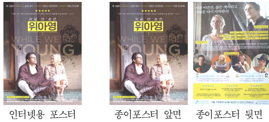
그림 3 인터넷용 영화포스터와 A4크기로 제작된 종이포스터의 비교

다. 셋째, 본 연구의 분석대상은 영화관에서 입수 가능한 A4크기의 양면 종이 포스터와는 다르다. 종이포스터의 앞면은 인터넷에서 검색한 디지털 이미지와 동일하지만 종이광고의 경우 그림 3에서 볼 수 있듯이 뒷면에 영화의 주요장면은 물론 줄거리, 인물, 테스트모니얼 등의 내용이 보다 상세하게 제시된다. 본 연구는 종이포스터의 뒷면에 제시되는 이러한 내용은 고려하지 않고 오로지 한국영상자료원에서 제시하는 공식포스터의 이미지만을 분석 대상으로 한정하였다.