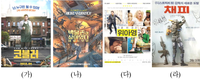
그림 10 이미지 명시화의 사례

(가) 영화소재·테마와 관련된 이미지를 추가하여 명시화하는 경우: <코블러>는 다른 사람의 신발을 신으면 그 사람의 모습으로 변하는 구두수선공 맥스의 스토리를 담은 영화이다. 국내포스터에서는 이러한 신발 이야기를 보다 명시적으로 표현하기 위해 포스터 좌우측 하단에 배경이미지와는 어울리지 않는, 여러 켈레의 신발 이미지를 삽입하였다. 신발 이미지의 삽입은 영어포스터의 이미지와 비교해 볼 때 거의 유일한 변화이다.