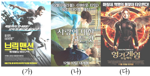
그림 5 헤드라인 명시화의 사례

(가) ‘음차 + 서브헤드라인’을 통한 명시화: <브릭맨션 — 통제불능 범죄구역>은 Brick Mansions 를 원제로 하는, 영화 <13구역>의 리메이크작이다. 4) 한국어 포스터에는 “통제불능 범죄구역”이라는 서브헤드라인(부제)이 추가되어 헤드라인의 의미가 구체화되었다. 특히 서브헤드라인의 “구역”이라는 단어는 리메이크 원작을 연상케 한다는 점에서 영화의 장르, 내용, 느낌 등을 예측 가능하게 만든다. 영화 <아노말리: 타임게이트>, <더 기버: 기억전달자>, <포스마쥬어: 화이트베케이션> 등도 음차번역과 함께 서브헤드라인을 추가함으로써 헤드