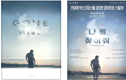
그림 2 영화 <나를 찾아줘>의 포스터(영어와 한국어의 비교)

본 연구의 목적은 국내 외화포스터에서 전형적으로 드러나는 ‘명시화’(explicitation) 전략이 어떠한 양태로 발현되는지 포스터의 구성요소에 따라 세부적으로 탐구하는 것이다. 1) 이를 위해 필자는 명시화와 관련된 기존의 번역학 이론을 종합적으로 고찰한 후 국내의 외화포스터에 적용할 수 있는 명시화의