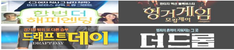
그림 8 슬로건 명시화의 사례

명시화를 위해 국내포스터가 사용하는 슬로건은 크게 세 가지 유형으로 나뉜다. 첫째, 감독 또는 배우를 명시화한 슬로건이다. 이러한 슬로건은 영화 그 자체보다는 감독과 배우의 유명세를 이용하여 영화를 어필하려는 경우에 활용된다. 예컨대 영화 <한번 더 해피엔딩>의 슬로건("<그 여자 작사 그 남자 작곡> 마크 로렌스 감독 × 휴그렌트")은 마크 로렌스와 휴그렌트가 영화 <투 위크스 노티스>로 시작해 동일 장르의 영화로 네 번이나 호흡을 맞춘 점을 감안한 슬로건이다. 영화포스터와 관련된 한 설문조사에 따르면, 전체 응답자 158명 가운데 약 23.4%(37명, 선택지 가운데 2위)가 '영화배우나 감독을 보고 영화를 선택한다'고 답변한 바 있다(임성택 2005: 350).