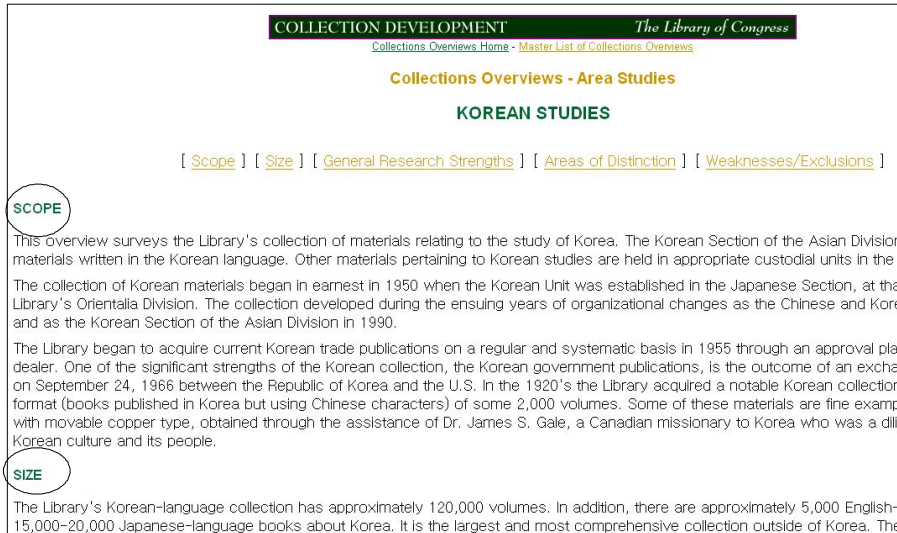
(그림 2) 한국학 연구