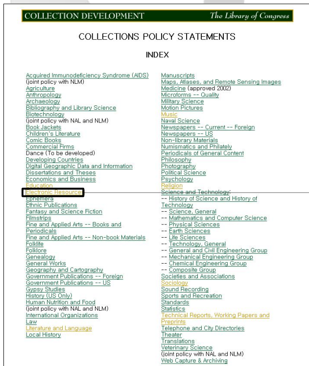
(그림 3) 장서개발 성명서 색인

호주 국가도서관 장서개발정책 성명서는 14개의 항목으로 구성되며 부록을 첨부하고 있다(표 2). 서문에서는 장서개발정책의 목적, 집서의 접근, 집서의 보존, 도서관 자료의 제적 및