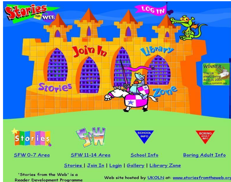
(그림 2) 7-11세 어린이방의 홈페이지

게 하여, 결과적으로 글쓰기나 그림 그리기 등의 창작을 적극적으로 할 수 있도록 유도하기 위한 것이다.