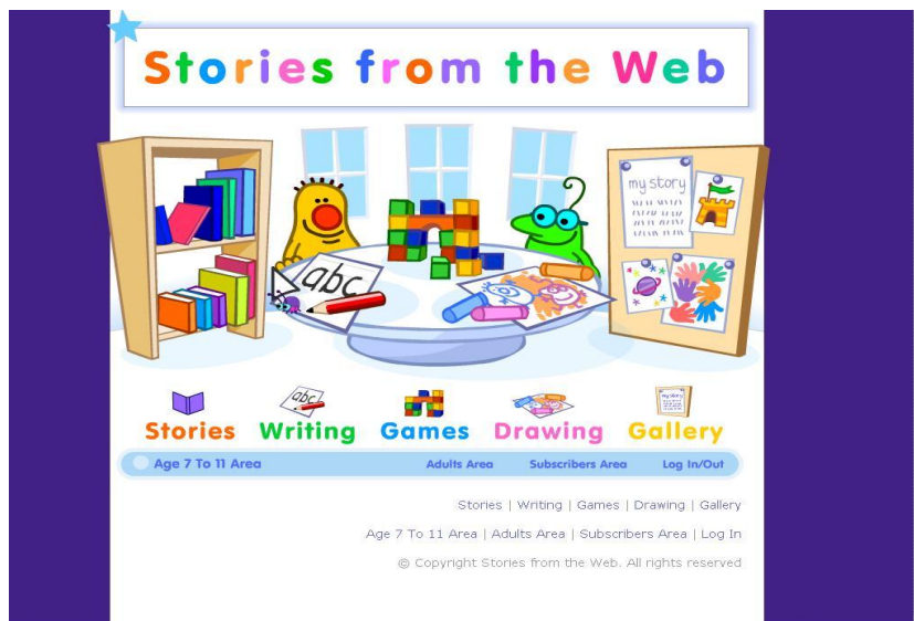
(그림 1) 0-7세 어린이방의 홈페이지