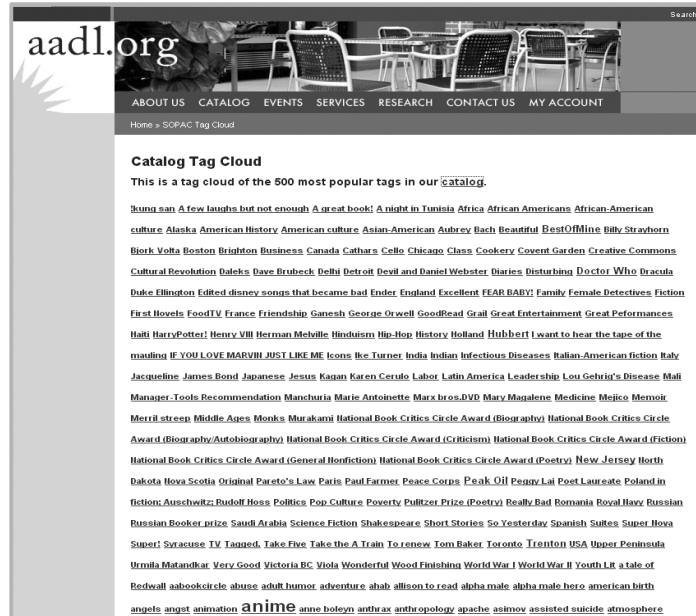
(그림 5) 태그 클라우드를 서비스하고 있는 SOPAC

있다. 어린이와 청소년을 대상으로 하는 도서관에서 RSS를 제공하면 도서관의 신착자료, 새소식 등을 시의적절하게 전달할 수 있다.