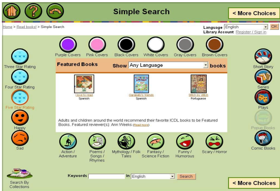
(그림 2) ICDL 단순 검색 페이지 2