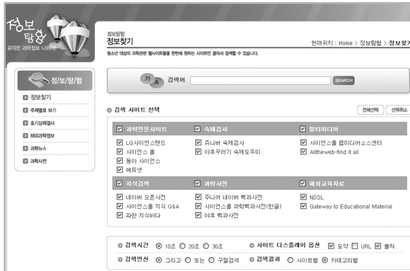
(그림 3) LG사이언스랜드 정보찾기