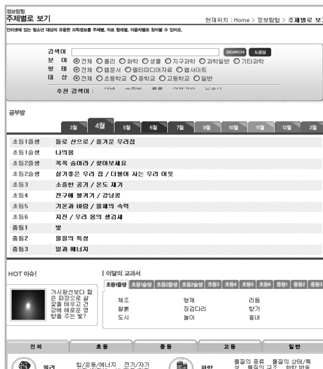
(그림 4) LG사이언스랜드 주제별로 보기