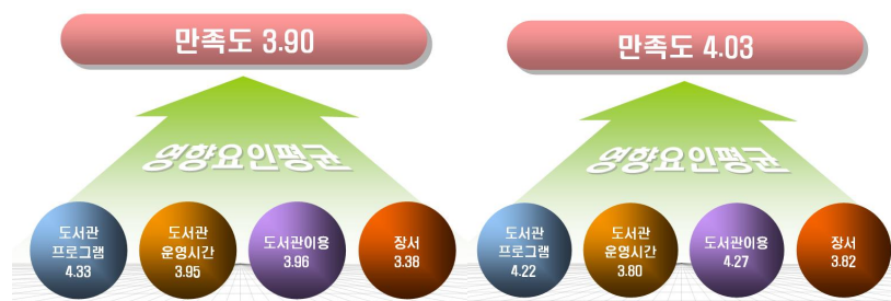
(그림 1) 활성화 사업에 대한 만족도 비교(2005_왼쪽, 2006_오른쪽)

위에서 설명했듯이 위의 네 가지 요인 외에 학업성취도 및 만족도에 영향을 미치는 요인으로 알려져 있는 시설 및 공간 요인이 평균 만족도 산출을 위해 사용이 되었는데, 그 결과는 3.86