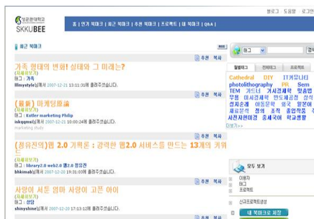
(그림 5) 성균관대학교 중앙 학술 정보관의 SKKUBEE 메인화면

이용해 이미지를 직접 링크함으로써 도서관 안에서 바깥으로 정보봉사를 확장시키는 것을 볼 수 있었다. 그림 5와 그림 6은 성균관대학교 SKKUBEE와 포항공대 청암 학술 정보관 블로그 사례를 보여주는 예이다.