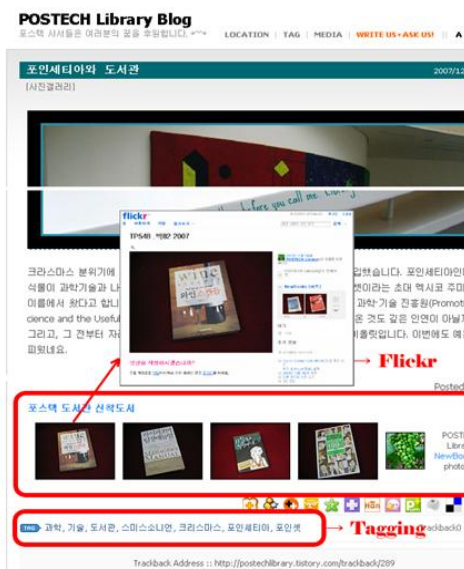
(그림 6) 포항공대 청암 학술 정보관 블로그