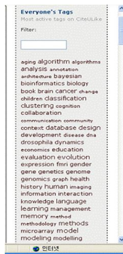
(그림 2) 태그 클라우드 적용 사례를 보여주는 CiteULike의 화면

라인 목록이 수록하고 있는 양질의 레코드들과 웹사이트를 북마크할 수 있게 하고 이 정보원들을 다른 사람들과 공유할 수 있도록 하는 기능을 제공하고 있다. 이렇게 폭소노미를 적용하는 경우 이용자들 또한 따로 “projects”와 같이 해당 주제만을 위한 특정 사이트 하나에 링크를 걸어 자신들만의 정보 공유를 시도할 수도 있다. 이는 관련 주제에 관심이 있는 학생들 또는 해당 과목을 수강하는 학생들에게 프로젝트 관련 정보를 저장, 공유할 수 있는 공간을 제공함으로써 해당 과목, 해당 프로젝트에 필요한 웹 정보들을 하나의 디지털 공간에 저장하고 공유한다. 이는 언제 어디서나 필요한 정보를 접근하고 다른 구성원들과 공유할 수 있으므로 불필요한 물리적 짐을 줄이고 프로젝트의 질을 높이는데 효과적인 보조수단으로 사용되고 있다. 그림 3과 그림 4는 PennTags의 메인 화면과 프로젝트 링크들을 “projects”라는 공간에 모아 접근할 수 있게 한 링크들의 화면이다.