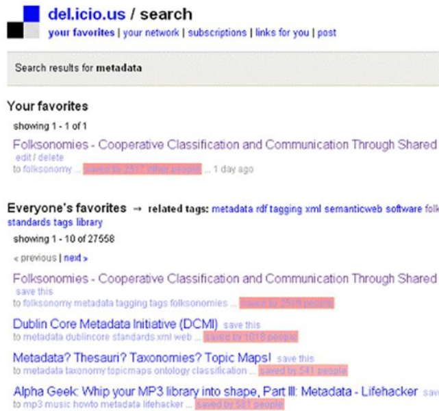
(그림 1) Favorite에 저장된 웹사이트를 보여주는 del.icio.us 화면

del.icio.us의 경우, 이용자는 “Favorites” 또는 “Bookmarks”를 온라인으로 저장하고 태그를 부착함으로써 언제 어디서나 컴퓨터만 있으면 그 내용들에 접근할 수 있다. 개인 백화점처럼 이용할 웹사이트 내용을 개인이 만들고 링크를 다른 사람에게 전달할 수 있는 기능도 존재하기 때문에 직원이 만든 상품 소개 사이트나 연관 은행계좌등의 링크를 본사나 영업부에 전송하는 등 업무상에 있어서의 활용 또한 가능하다 28) (그림 1 참조).