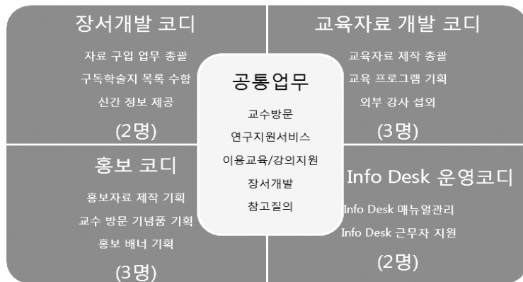
<그림 2> 서울대 코디네이터제의 업무분장(홍순영 2008)