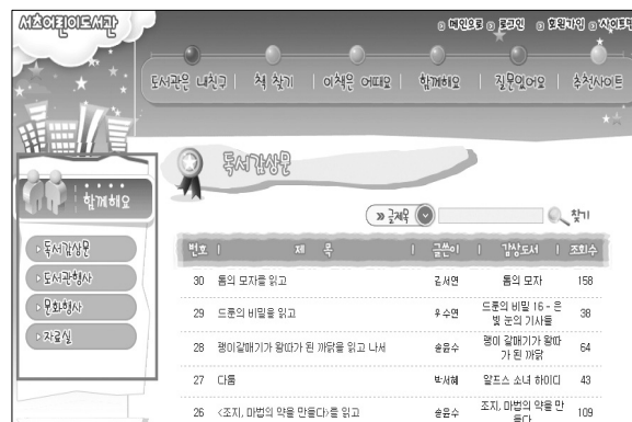
〈그림 2〉 웹사이트의 로컬 네비게이션 예3)

로컬 네비게이션 시스템(Local Navigation System)은 사이트의 규모가 방대하고 복잡한 경우, 서브 카테고리 나누어서 서브 사이트 내에서 글로벌 네비게이션 역할을 하는 네비게이션 시스템이다. 로컬 네비게이션 시스템은 각 서브사이트에서 사용자가 어디에 있는지 항상 선택이 가능해야 하며 글로벌 네비게이션과 마찬가지로 항상 최상위 페이지로 이동할 수 있는 링크로 연결해야 한다.