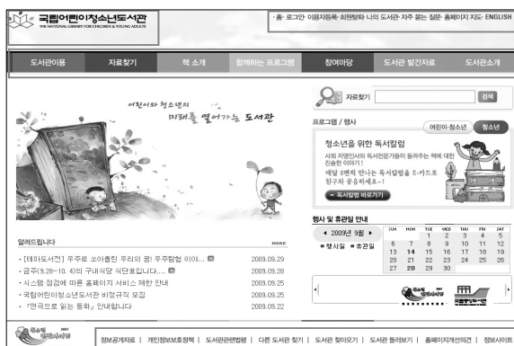
〈그림 1〉 웹사이트의 글로벌 네비게이션 예2)

국소적 네비게이션 시스템(Ad-hoc Navigation System)은 상황에 따라 변하는 네비게이션 시스템을 말한다. 글로벌 네비게이션 시스템이나 로컬 네비게이션 시스템은 그 지역에 속한 모든 페이지에서 동일한 네비게이션 시스템을 제공하는 것인 반면, 국소적 네비게이션 시스템은 각 페이지마다 다른 내용을 제공하는 네비게이션 시스템이다. 국소적 네비게이션의 종류로는 문맥 네비게이션, 위치 추적 네비게이션, 관련사이트 링크 등이 있다. 〈그림 3〉은 문맥 네비게이션의 예이다.