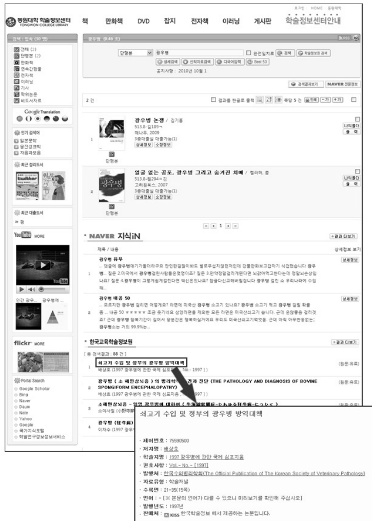
〈그림 1〉 D대학 도서관 검색결과 화면

2010년 9월 16일까지 10일간 이루어졌다. 설문은 학술정보센터 이용 제반사항, 홈페이지의 검색 만족도, 콘텐츠 만족도, 콘텐츠 이용, 통합검색 전반적 평가 등에 대한 내용으로 구성되었다(표 2 참조). 특히 검색 만족도는 1(매우 낮음)부터 5(매우 높음)까지의 리커트척도로 평가하도록 하였고 콘텐츠 만족도는 각 측정 항목별 콘텐츠의 순위를 매기도록 하였다. 피실