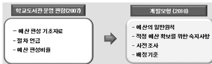
<그림 1> 예산편성 기준 비교

넷째, 기존의 인력 기준에서는 사서교사가 가져야 할 자질이나 역할에 대한 구체적인 기준을 명시하지 않고 있으며 현실적으로 보면