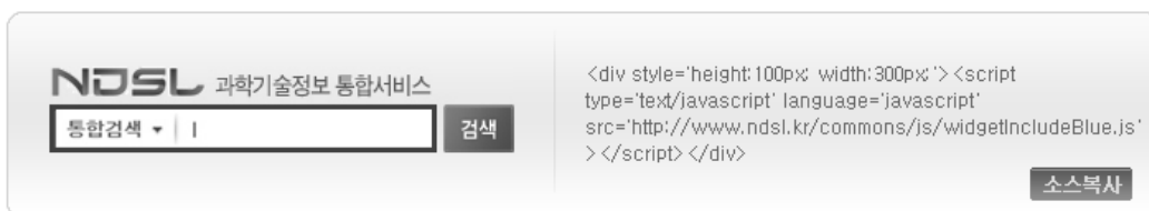
<그림 4> NDSL 검색창

NDSL 콘텐츠 활용에 대한 양 기관간 이해 및 합의가 이루어지면, NDSL 검색창을 통한 이용을 제외하고 NDSL을 운영하는 KISTI와의 협약이 필요하다. 다만 그 활용 정도에 따라 콘텐츠 활용동의서, 공동활용 협약서, 기관간 업무양해각서 등으로 구별할 수 있다. 오픈 API 방식으로 NDSL 콘텐츠를 활용하는 경우, 콘텐츠 활용동의서를 제출해야 하고, stOAI 방식으로 콘텐츠를 이관하는 경우 공동활용 협약을 체결한다. 그 외에도 상호간에 보다 긴밀한 업무협력이 필요한 경우 기관간 업무양해각서로 협약을 체결할 수 있다.