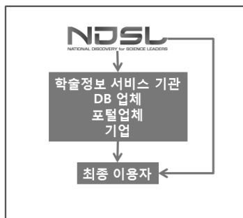
<그림 3> NDSL 콘텐츠 유통 모형

한편 NDSL 콘텐츠 유통 모형은 <그림 3>과 같이 제시할 수 있는데, 학술정보 서비스 기관, DB·포털 업체, 기업 등을 통해 최종 이용자에게 콘텐츠를 제공하거나 혹은 최종 이용자가 NDSL 콘텐츠를 직접 활용할 수 있도록 NDSL 콘텐츠를 개방하고 있다.