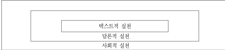
<그림 1> 페어클로우의 비판적 담론분석

출처: 정미정, 백선기, 2011. 한국 신문의 영화에 관한 보도담론의 특징과 의미: 산업담론과 문화담론의 대립적 갈등을 중심으로. 『한국언론학보』, 55(3): 39.