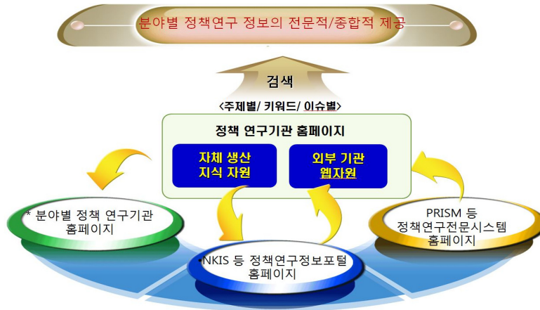
〈그림 2〉 분야별 정책연구정보의 웹자원화 체계도

결과적으로 국가정책지식정보시스템이나 공유시스템은 정책정보의 종합적인 아카이빙과 동시에 이를 지식자원으로 체계화하여 관리하는 센터의 역할을 하고, 분야별 정책연구기관은 단위기관의 홈페이지를 통해 분야별 전문화를 통해 정책연구와 정책당국을 위한 전문정보자원으로 활용 가능토록 해야 한다. 웹자원을 활용한 분야별 정책정보의 전문적이며 종합적인 제공이 〈그림 2〉와 같이 이루어져야 할 것이다.