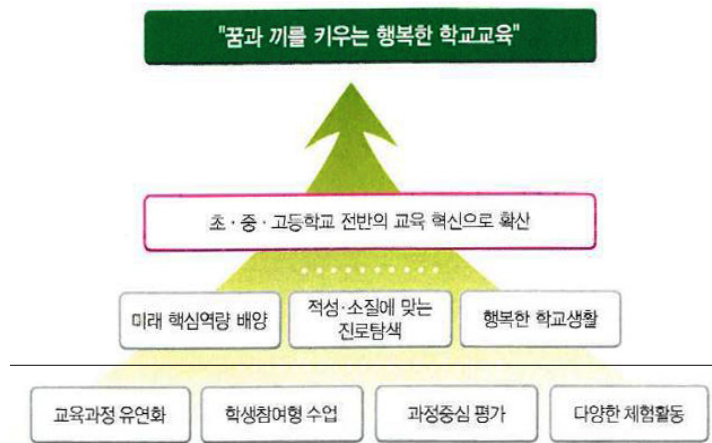
〈그림 2〉 자유학기제의 비전(교육부; 한국교육개발원 2014)

이러한 자유학기제 추진의 구체적인 목적은 첫째, 학생들이 스스로 꿈과 끼를 찾고, 자신의 적성과 미래에 대해 탐색·고민·설계하는 경험을 통해 지속적인 자기성찰 및 발전할 수 있는 기회 제공 둘째, 지식과 경쟁 중심 교육을 자기주도 창의학습 및 미래지향적 역량(창의성, 인성, 사회성 등) 함양이 가능한 교육으로 전환 셋째, 공교육 변화 및 신뢰회복을 통해 학생이 행복한 학교생활 제공이다.