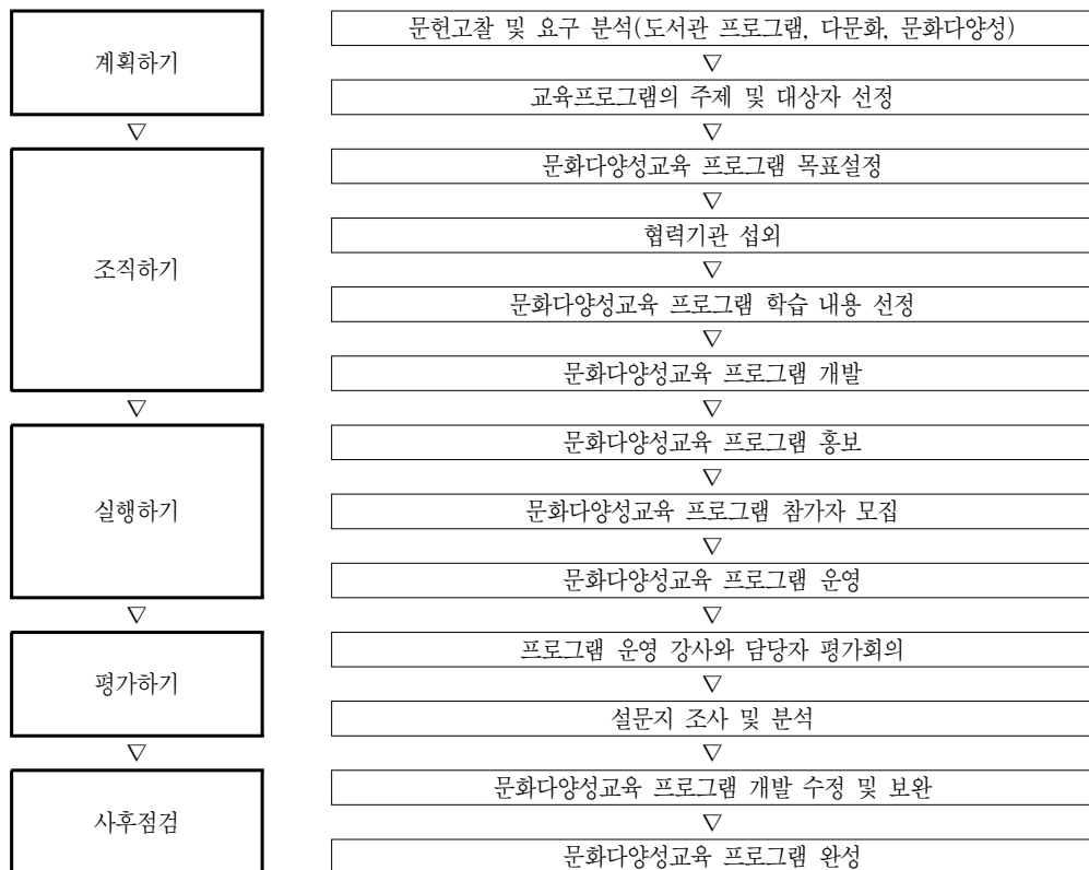
〈그림 2〉 도서관 문화다양성교육 프로그램 개발을 위한 매뉴얼

계획 단계에서는 문화다양성 및 다문화교육 프로그램과 관련 있는 선행연구를 분석하여 관련성을 도출하고, 도서관에서의 문화다양성교육의 필요성을 확인하였다. 또한 다문화가정과 일반가정 어린이들을 대상으로 다양한 사람들이 서로를 존중하는 세상과 다양한 모습으로 소통하며 함께 살아갈 수 있는 세상을 만들 수 있도록 환경을 조성하고 세계 각 나라의 문화를 알 수 있는 멀티동화를 활용하여 문화 이해를 도울 수 있는 콘텐츠를 찾아 주제를 선정하였다.