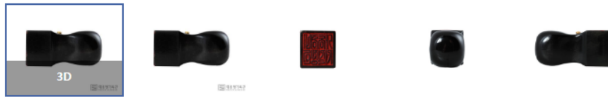
〈그림 3〉 대통령비서실장인(노무현)