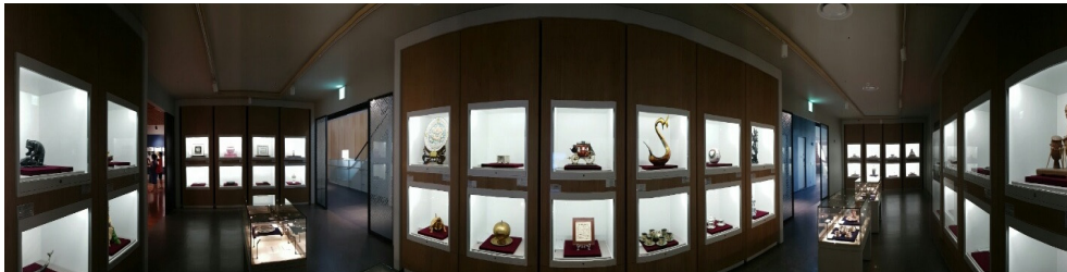
〈그림 2〉 카드보드 카메라를 이용한 파노라마 영상

보드 카메라 어플리케이션을 이용하여 파노라마 이미지를 만든 것이고, 카드보드를 이용해 3D VR 감상도 가능하다.