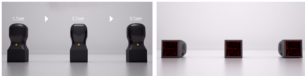
〈그림 7〉 대통령비서실장인(노무현) 렌더링

했는지, 또는 굴곡의 자연스러운 정도 등에 따라 나뉘며, 〈그림 6〉에서는 3-type이 가장 실제 전시물과 유사한 자연스러운 렌더링이 진행되었다고 확인할 수 있다.