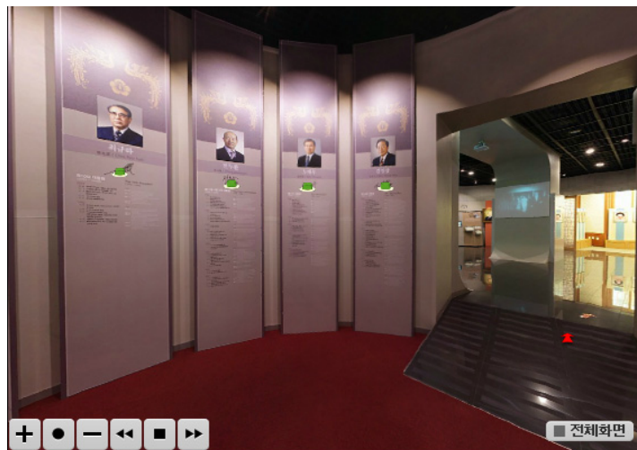
〈그림 4〉 사이버 전시관(상설)