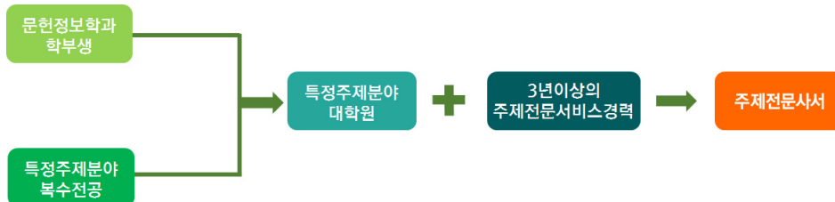
<그림 2> Case 2: 문헌정보학과 학생의 주제전문사서로의 로드맵