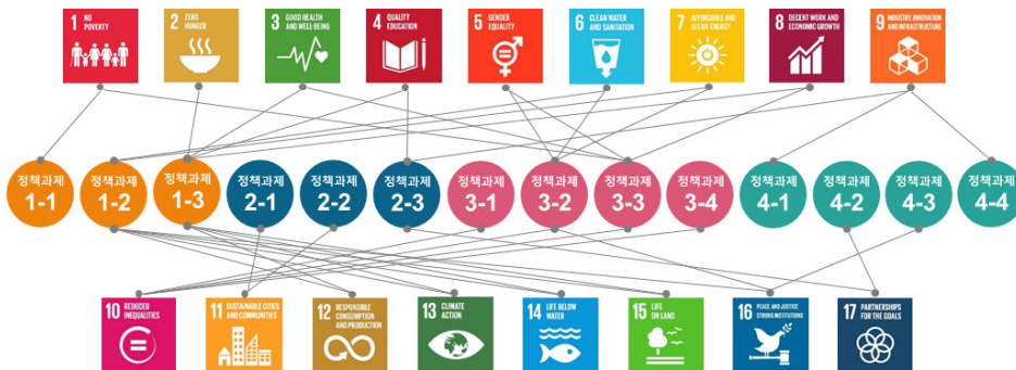
<그림 2> 제3차 도서관종합발전계획과 UN SDGs의 의제비교

본 연구에서는 UN SDGs의 17개 목표와 도서관종합발전계획과의 의제를 비교함으로써 도서관이 유엔이 제시한 지속가능발전목표를 달성하는데 어느 정도 기여하고 있으며, 특히 우리나라 제 3차 도서관종합발전계획과의 관련성을 분석함으로써 이 계획의 미래가치를 논의하고자 하였다. 그 비교결과를 도식화하여 제시하면 <그림 2>와 같다.