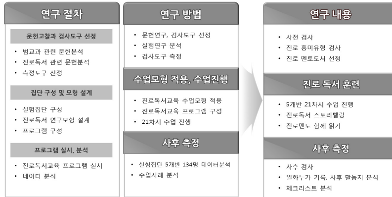
〈그림 2〉 진로독서 프로그램 연구 수행 절차 및 내용