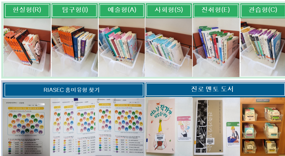
<그림 3> 진로독서 자료 사진

이 절에서는 범교과 기반의 진로독서 사전 데이터 분석을 위하여 진로독서 활동 진행 및 완료 후 집단별 흥미유형의 선호적, 선택적 경향을 분석하기 위해 홀랜드의 흥미유형 분석을 실시하였다. 흥미유형 분석은 RIASEC의 심리유형은 하나의 닳은 유형과 특성의 유사한 정도에 따라서 특정 지을 수 있다. 본 연구의 실험집단별 흥미유형에 대한 양적자료 처리는 SPSS 25.0 for Windows 프로그램을 사용하여 점수와 교정평균 비교를 각각 나타낸 홀랜드 흥미유형의 집단별 분포 교차분석 결과는 다음의 <표 10>과 같다.