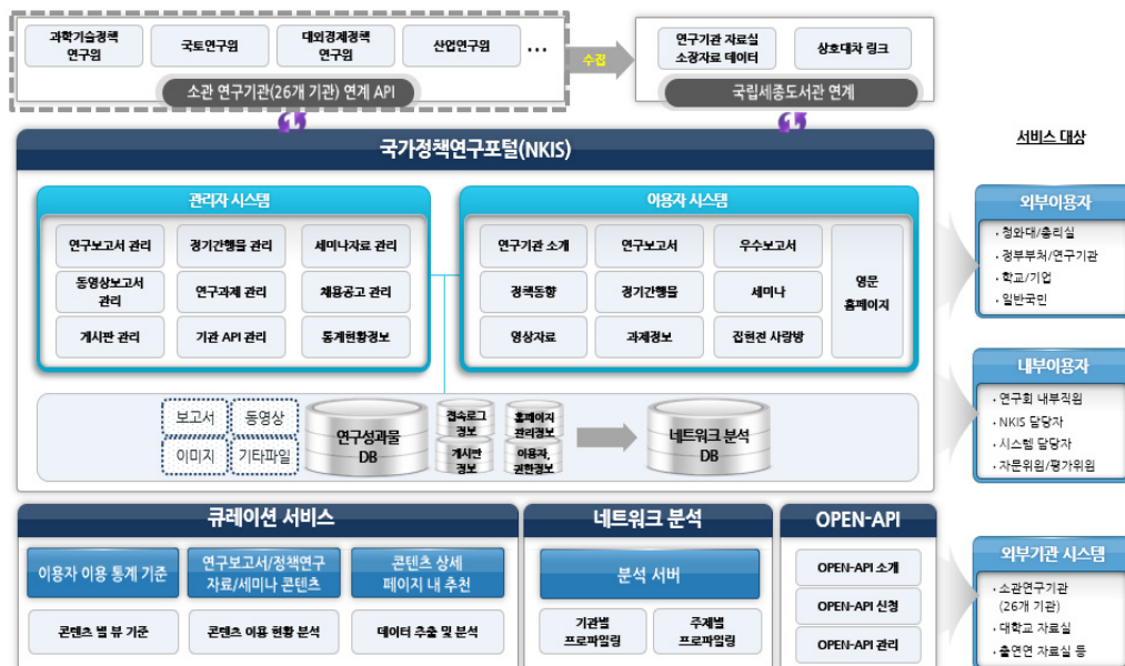
<그림 3> NKIS 시스템 구성도(경제인문사회연구회, 2021, 5)