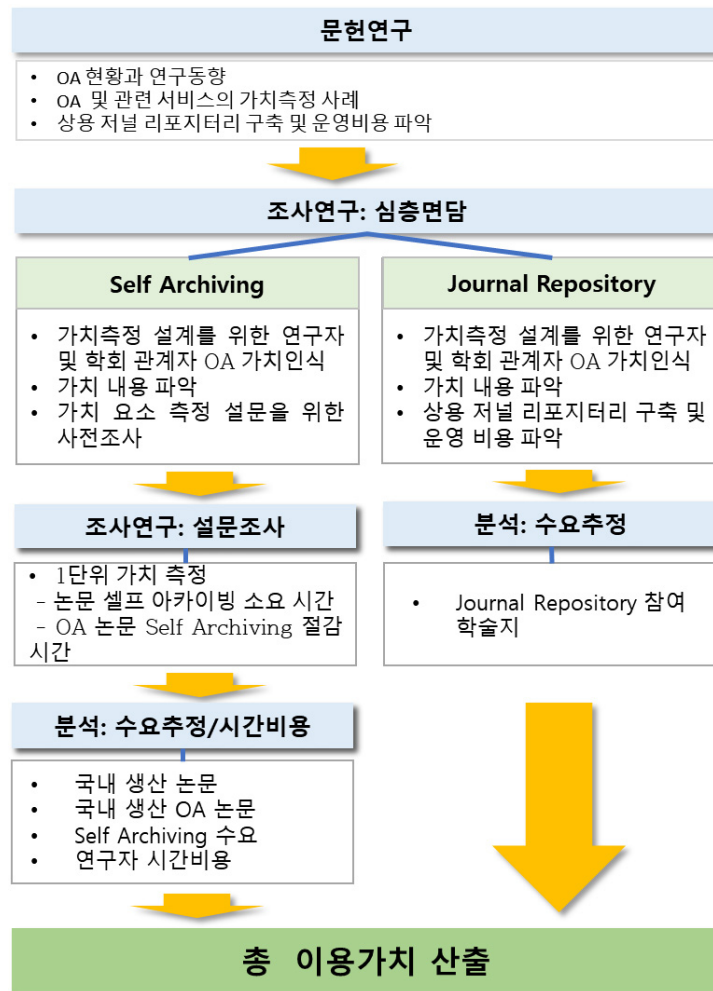
〈그림 1〉 연구 수행 과정