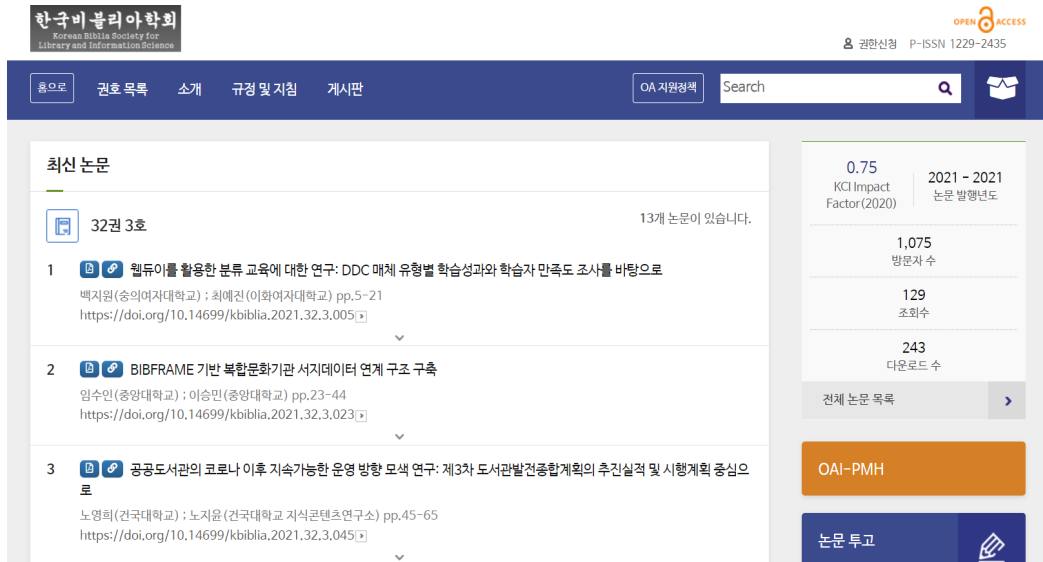
〈그림 5〉 AccessON의 Journal Repository 활용 학회지 홈페이지 서비스 예시