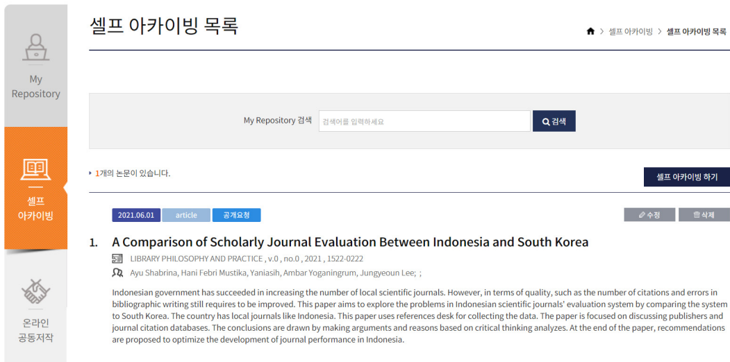
〈그림 4〉 AccessON의 Self Archiving 시스템

AccessON의 Journal Repository는 KCI와 달리 개별 학술지의 리포지터리로, 국내 학회들이 OA 학술지로의 쉽게 전환할 수 있도록 무료로 제공되고 있다. 주요 서비스는 학술지 홈페이지 구축 및 관리, DOI 랜딩 페이지 기능이다. 학술지의 접근성을 향상시키기 위하여 구글과 네이버와 연동되어 있어 논문의 이용과 인용의 증가를 기대할 수 있다. 3) 학회에서는 학술지 논문을 관리하고, 이용자들은 학술지의 목적과 범위, 투고규정 등 학술지 정보를 확인할 수 있으며, 논문의 서지정보와 원문을 학술지 홈페이지를 통해 무료로 볼 수 있다. 2022년 8월 현재 45개 학술지가 가입되어 있다(〈그림 5〉 참조).