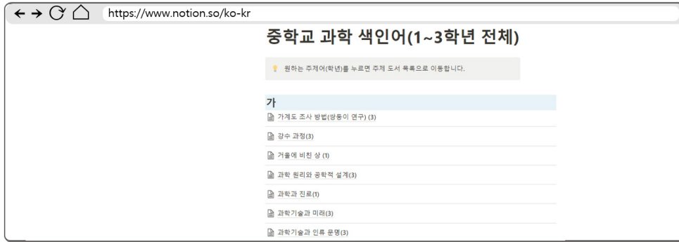
〈그림 5〉 중학교 과학 전 학년 단원주제 색인 시스템 화면