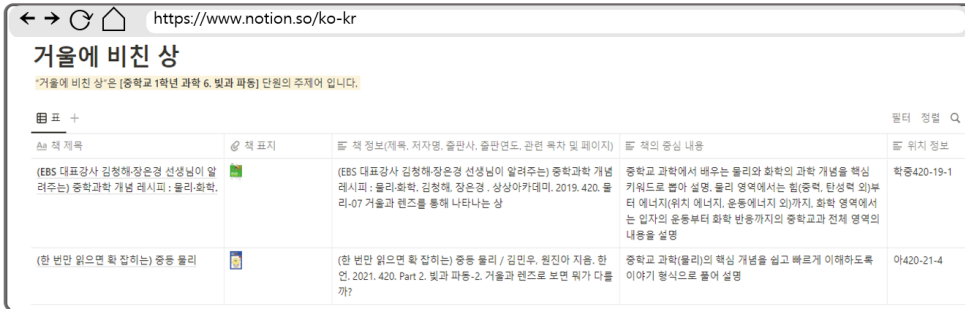
〈그림 6〉 색인 도서목록 화면(중 1학년 '6. 빛과 파동' 단원 '거울에 비친 상')

템의 연계 도서목록 페이지는 단원주제 도서목록 시스템의 목록 페이지와 구성이 거의 일치한다. 이처럼 단원주제 색인 시스템은 기존의 단원주제 도서목록 시스템이 가진 [학년 - 단원-주제어]의 순차적 이동이 아닌, 주제어에서 도서 목록으로 바로 이동할 수 있도록 하였다.