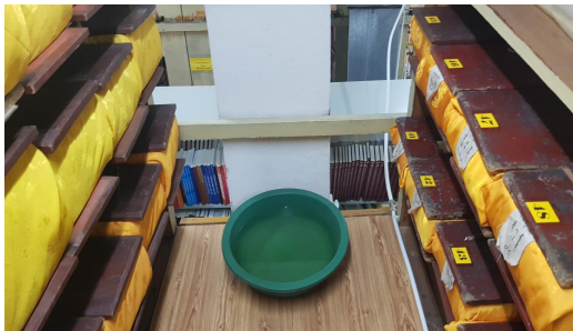
고문서 보존 환경

몽골 국립박물관은 2023년 기준 약 6만 점의 유물을 보존하고 있다. 몽골 국립박물관은 4년마다 보유하고 있는 유물의 목록을 업데이트하여 문화부에 제출해야 하지만 바코드 시스템을 통해 유물을 점검하여 4년마다 자체 유물을 확인하는 것이 어려운 상황이다.