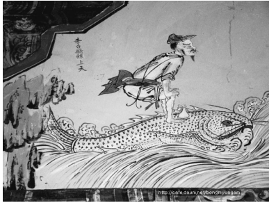
그림 2. 남장사 극락보전 벽화

어 있어, 이는 당시 매우 일반화 된 표현이라 할 수 있다. 때문에 이식도 임숙영의 죽음을 이태백이 고래를 타고 죽은 것에 비유하고 있으며, 이는 결과적으로 임숙영의 뛰어난 자질을 드러내기 위한 시적 표현이라 하겠다.