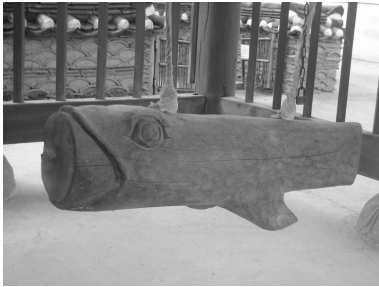
그림 3. 수덕사의 고래 모양 당목

①에서 경어(鯨魚)가 우는 소리는 절에서 시각을 알리는 종소리를 의미한다. 절에서 종을 치기 위한 당목(撞木)을 고래 형상으로 만드는데, 고래가 종을 치는 상징적 행위를 통해 시간을 알리기도 하고 신도를 불러 모으는 역할을 한다. 때문에 절에서의 범종은 경