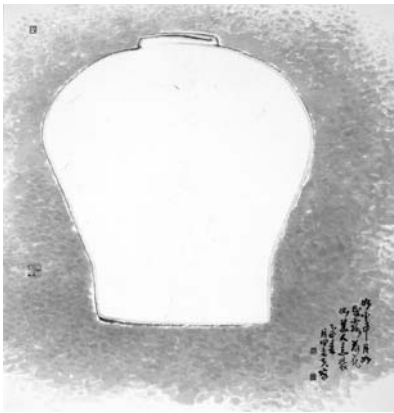
<그림 1> 백자 87×81cm, 1969

다음의 <그림 1>은 <백자(1969)> 6) 이고, <그림 2>는 <백자(1979)>이다. 글 (1)과 (2)는 각각 <그림 1>과 <그림 2>의 화면상에 적혀진 것이다.