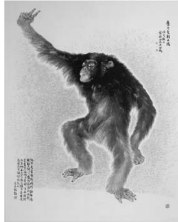
〈그림 12〉 춤추는 유인원 176×140cm, 1988 가을