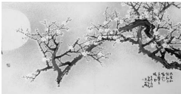
<그림 6> 야매 64.2×127cm, 1979