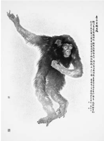
〈그림 11〉 춤추는 유인원 175×138cm, 1988 봄