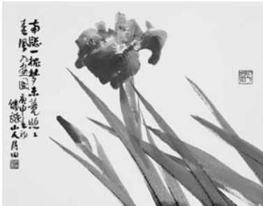
<그림 3> 창포화 40.5×31.5cm, 1980

다음의 <그림 3>은 <창포화(1980)>이고, <그림 4>는 <창포화(1981)>이다. 글 (3)과 (4)는 각각 <그림 3>과 <그림 4>의 화면상에 적혀진 것이다.