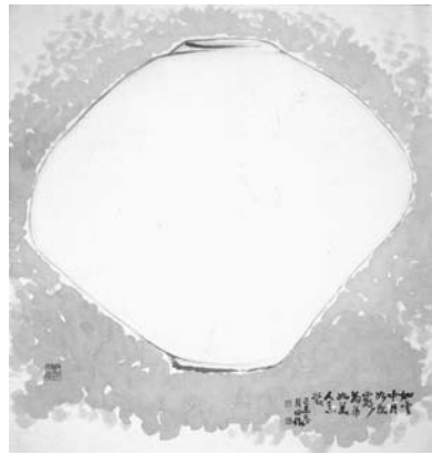
<그림 2> 백자 85×70cm, 1979