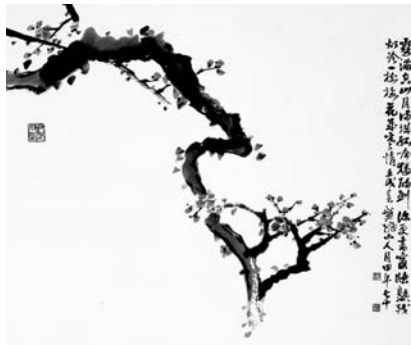
〈그림 8〉 홍매 61×73.5cm, 1982