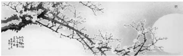
<그림 5> 야매 42×139cm, 1975

다음의 <그림 5>는 <야매(1975)>이고, <그림 6>은 <야매(1979)>이다. 글 (5)와 (6)은 각각 <그림 5>와 <그림 6>의 화면상에 적혀진 것이다.