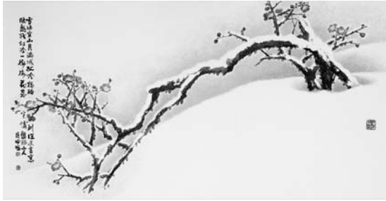
〈그림 7〉 설매 65×127cm, 1980