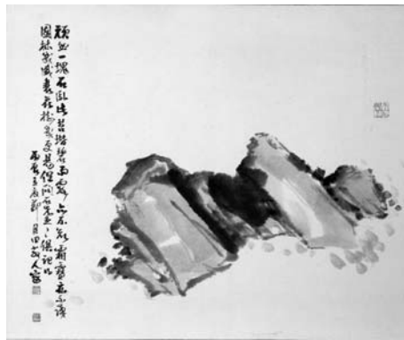
<그림 9> 돌 54.7×66cm, 1976

다음의 <그림 9>는 <돌(1976)>이고, <그림 10>는 <돌(1986)>이다. 글 (9)와 (10)은 각각 <그림 9>와 <그림 10>의 화면상에 적혀진 것이다