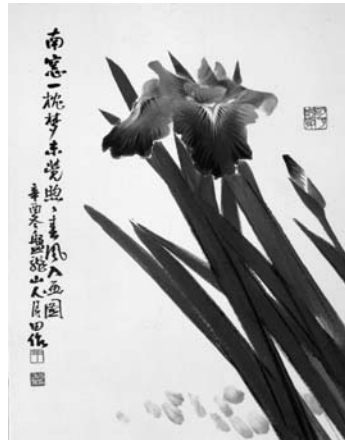
<그림 4> 창포화 41×31.5cm, 1981