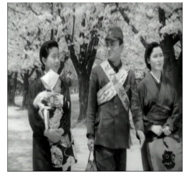
< 사진 15 > 에이류와 친구들