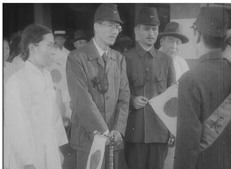
< 사진 8 > 세키의 환송식

넥타이가 합쳐진 테일러칼라 형태의 국민복 갑호로 일반 국민을 위한 의복이다.