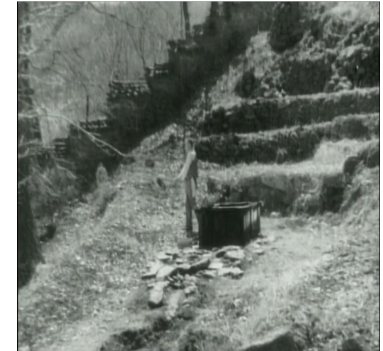
< 사진 12 > 무라이 부친의 아침