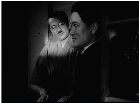
< 사진 1 > 지원병제도의 선포

<지원병>에서 흥미로운 것은 일본인 남성의 등장이다. 구장(區長)이라 불리는 이 인물은 천황의 군인이 되어 제국에 보은하고 싶지만 조선인이라는 신분에 가로막혀 괴로워하는 춘호에게 지원병제도의 실시를 알려 준다. 관객은 이 대목에 와서야 춘호가 우울해 하는 원인을 이해하게 된다. 그는 극의 초반부터 우울하고 답답한 표정으로 등장하지만 관객에게