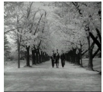
< 사진 13 > 무라이 집, 에이류