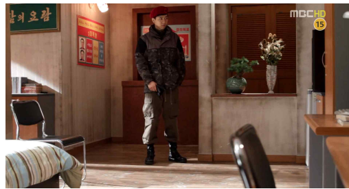
<그림 2> <더킹 투하츠> 3회

위의 장면은 장교대회를 위해 남북한 군인들이 머물게 되는 남북한의 숙소를 보여주는 장면이다. 심리학적으로 영화의 색상이 분위기를 묘사한다 17) 고 할 때, <그림 1>과 <그림 2>는 큰 차이를 보인다. 남한의 숙소