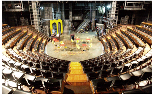
<그림 1> 드라마센터