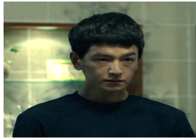
<그림 5> 검은 기운(11회)