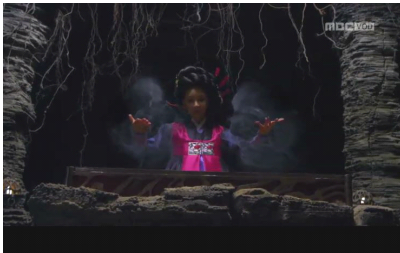
<그림 3> 주술과 영혼봉인 (8화)

같은 아브젝션(abjection)이미지로 넘쳐난다. 즉 경계와 위치, 규칙이 무너지고 정체성과 체계, 질서가 교란되어 있다. 23) 게다가 자기 맘에 들지 않으면 눈을 치켜뜨며 소리를 질러 공포 분위기를 고조시킨다. 이 작품에서 무연은 강한 힘을 가졌지만 타인 착취에 죄책감을 가지지 않고, 자기 뜻대로 되지 않을 때는 분노를 표출하는 괴물이다. 즉 여성의 힘과 악을 같은 축으로 놓았다. 게다가 무연이 욕망을 품게 된 계기의 옹고 그림을 판정하지 않는다. 대신 무연의 금