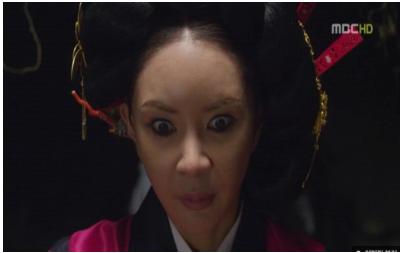
<그림 2> 무연에 빙의된 흥련 (7화)