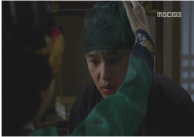
<그림 7> 기억 삭제 (16화)