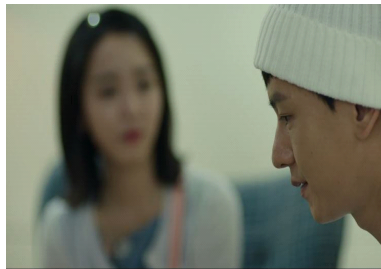
<그림 10> 기억상실(16회)