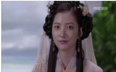
<그림 1> 무연의 원래 모습 (17회)

무연은 선녀였을 당시 <그림 1>처럼 청초했다. 하지만 인간에 빙의한 무연은 어두운 공간에서 검은 기운을 뿜으며 <그림 2>처럼 원색의 복장과 장신구를 한 채 등장한다. 인간의 몸에 깃든 무연