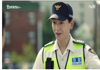
<그림 4> 선한 표정(5회)

이 검은 기운으로 덮여있고, 민머리에 혈관이 확장된 빨간 눈을 가졌으며 기괴한 소리를 내는 괴물의 형상이다. 검은색은 혼돈, 죽음과 무덤, 양면성, 무의식처럼 우울감이나 죄의식을 표상할 수 있기에 33) 악귀의 흔적을 시각화하는데 활용되었다. 거기에 그의 핸드폰 벨소리로 처리된 배경음