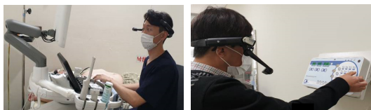
[Fig. 4] Expert in Specialized Education

장비를 조작하는 모습을 1인칭 시점으로 보여줌으로써 장비 작동 방법을 보다 쉽게 파악할 수 있다.