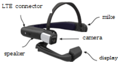
[Fig. 2] Realware Smart Glasses

접 작동하면서 진행하였고, 학습자인 공보의는 컴퓨터 화면을 통해서 학습할 수 있었다. 그림 2는 원격 교육에서 활용한 리얼 웨어의 모습이다. 리얼 웨어는 카메라와 화면을 갖고 있으며, 무선 인터넷을 통해서 카메라 영상을 서버를 통해서 원격 접속자에게 전달할 수 있다.