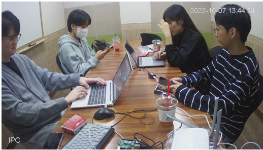
[Fig. 2] Web camera image